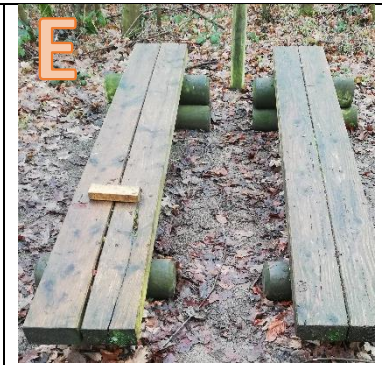
Welche Station ist das?