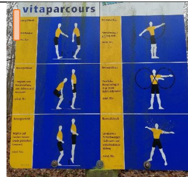
Welche Station ist das?