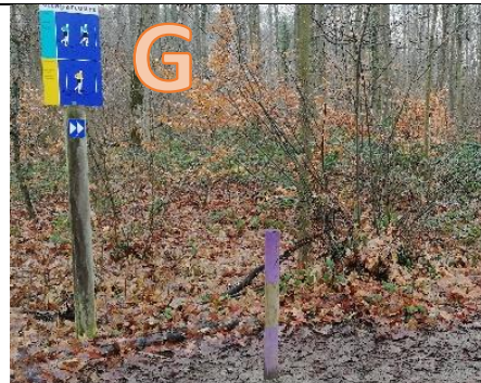
Welche Station ist das?