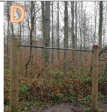
Welche Station kommt danach?