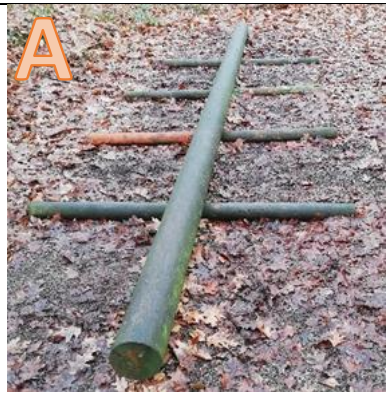
Welche Station ist das?