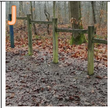
Wie viele Männchen haben ein gelbes Shirt an auf dem Schild?