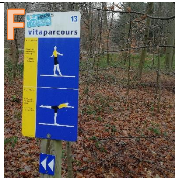
Wie viele Balancierbalken gibt es hier?