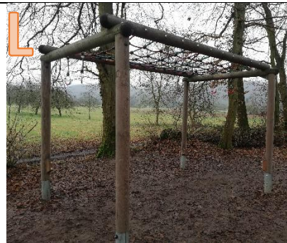
Für welche Fähigkeit ist keine Übung angegeben auf dem Schild? Beweglichkeit (26), Kraft (12), Ausdauer (22)