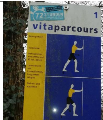
Wie viele Pfosten stehen hier?