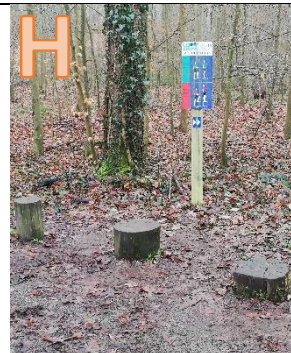
Wie viele Übungsbaumstümpfe gibt es?