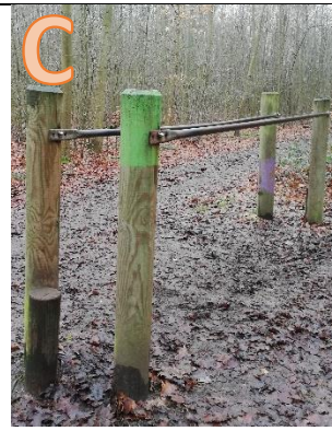
Welche Station ist das?