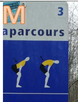
Für welche Fähigkeit ist diese Station? Beweglichkeit (24), Kraft (13), Ausdauer (10)