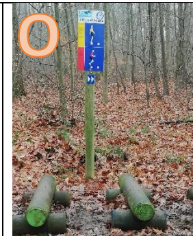
Wie viele Stämme gibt es zum Überspringen?