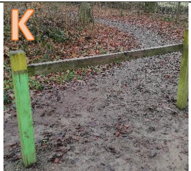
Für welche Fähigkeit ist diese Station? Beweglichkeit (16), Kraft (19), Ausdauer (25)